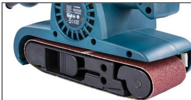
Fül zárva (a csiszolószallag feszes)