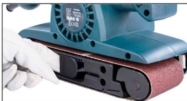
Fül kinyitása (a csiszolószallag fellazítása)