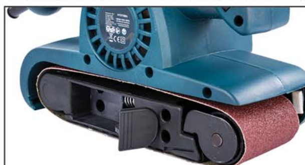
Fül nyitva (a csiszolószallag lecserélhető)