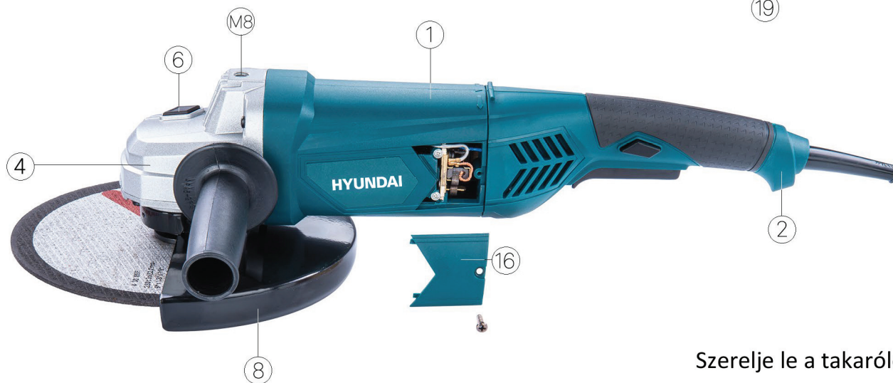
Szerelje le a takarólemezt