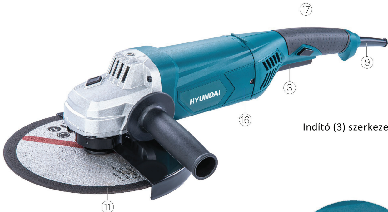
Indító (3) szerkezet

Emelje fel a rugót (19) a szénkefe (15) cseréhez (14)