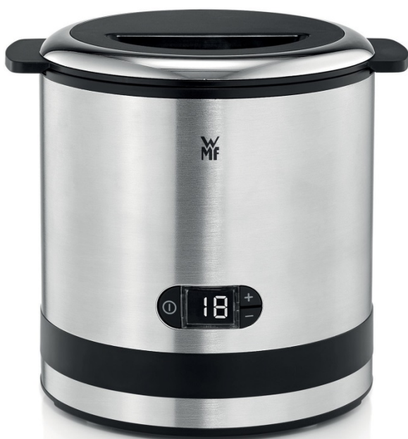
WMF KÜC-ENminis ® Fagylaltgép 3 in 1